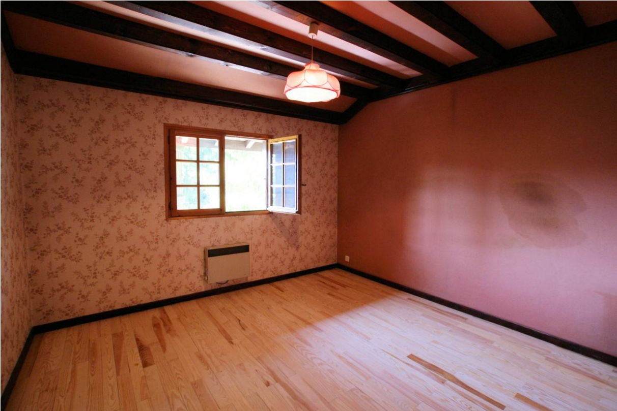
Chambre 2 :