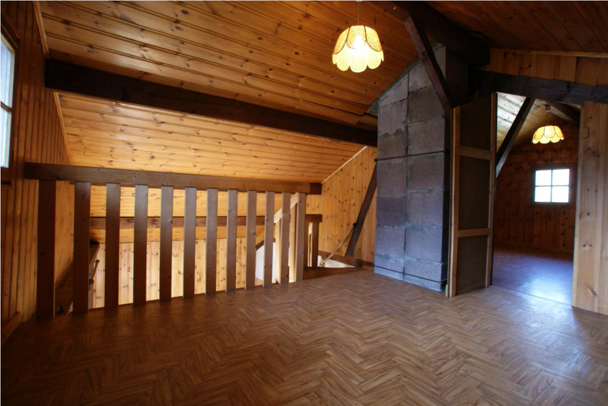
Rez de chaussée :