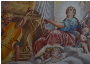
Le concert de Sainte Cécile Abbaye de Benediktbeuren (Bavière)

Création du programme lors de l'Estivale 2022 aux Châteaux des Allinges et des Baroques à Fillière