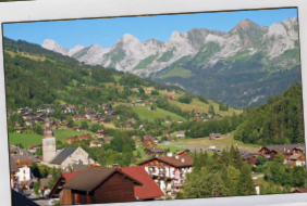
SÉJOUR AU GRAND-BORNAND