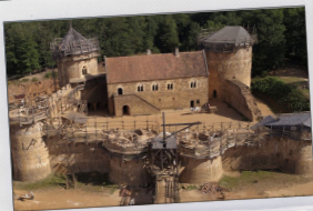
SÉJOUR À TREIGNY (BOURGOGNE)